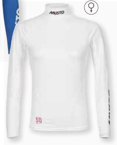
Championship L/S Rash Guard 82185 WOMEN'S Size XS-XL Black 990 | White 002 Sodalite Blue 586 8,360 円 (税抜定価 : 7,600 円)