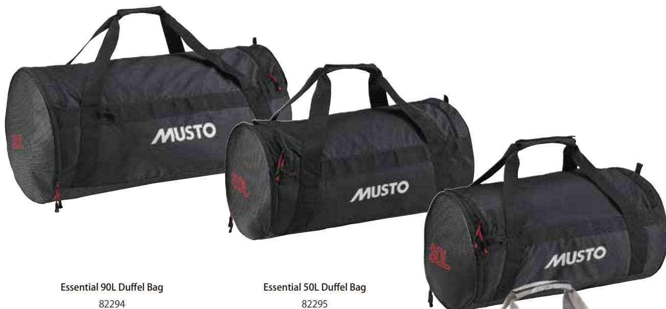
Essential 90L Duffel Bag 82294 90L / 78cm x 40cm x 40cm weight: 950g Black 990 | Platinum 813 24,200 円 (税抜定価 : 22,000 円)