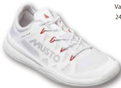
Dynamic Pro II Adapt 82028 WOMEN' S Size 5-10 | 5,5-9,5 True Navy 598 | White 003 24,750 円 (税抜定価: 22,500 円)