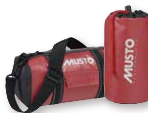
Genoa Mini Carryall