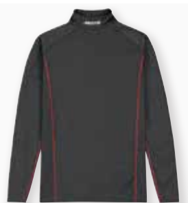
Thermal Base Layer L/S Top