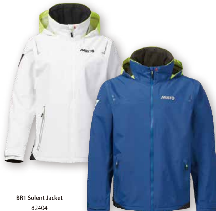
BR1 Solent Jacket 82404 Women's Size 8 - 16

White 002 | True Navy 598 | Black 990 40,150 円 (税抜定価: 36,500 円)