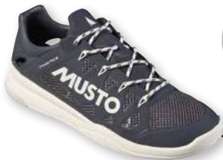
Dynamic Pro II 82026 7-13 | 7,5-11,5 Black 991 | True Navy 598 27,170 円 (税抜定価: 24,700 円)