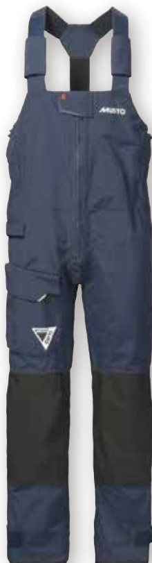
BR1 Channel Trousers