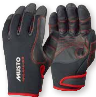
Performance Winter Glove