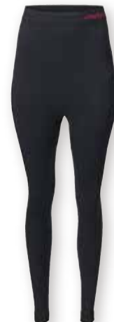
MPX Active Base Layer Trousers