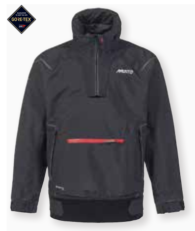
MPX GORE-TEX® Pro Race Offshore Smock 2.0 82304 XS – XXL Black 990 | Platinum 813 | Storm Cloud 548 152,900 円 (税抜定価：139,000 円)