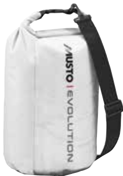
Evolution 20L Dry Tube 82281 20L / 22cm x 22cm x 53cm weight: 350 g Black 990 | Platinum 813 6,380 円 (税抜定価 : 5,800 円)