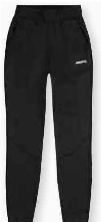
Frome Mid Layer Trousers