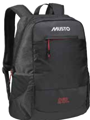
Essential 25L Backpack 82293 25L / 30cm x 15cm x 43cm weight: 550g Black 991 15,400 円 (税抜定価 : 14,000 円)