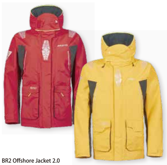
BR2 Offshore Jacket 2.0 82085

適用分野：オーシャン / オフショア / クルーザー / インショアレッシング / インショア、インランド & レジャー