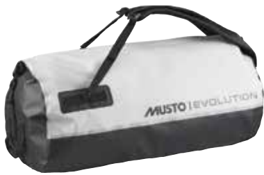
Evolution 65L Dry Carryall 82291 65L / 67cm x 29cm x 48cm weight: 700 g Platinum 813 | Gold 772 25,300 円 (税抜定価 : 23,000 円)