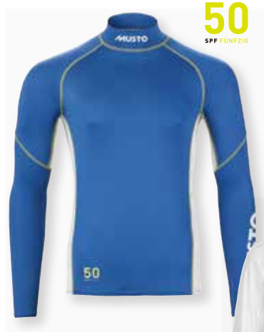
Championship L/S Rash Guard 82091 XS-XXL Black 990 | White 002 Aruba Blue 678 8,360 円 (税抜定価 : 7,600 円)