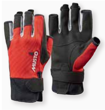
Essential Sailing Glove S/F

Black 991 | True Red 169 7,810 円 (税抜定価: 7,100 円)