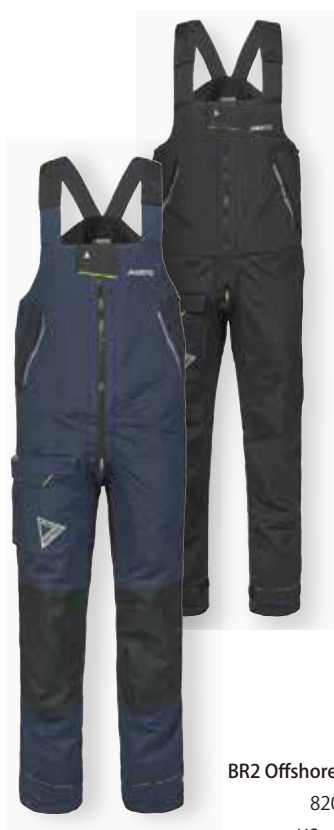
BR2 Offshore Trousers 2.0 82087