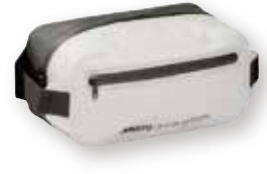
Evolution Dry Sling Bag 86085 6 L / 30cm x 15cm x 15cm Platinum 813 10,120 円 (税抜定価 : 9,200 円)