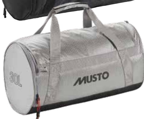
Essential 30L Duffel Bag 82324 30L / 48cm x 28cm x 28cm weight: 600g Black 990 | Platinum 813 17,050 円 (税抜定価 : 15,500 円)