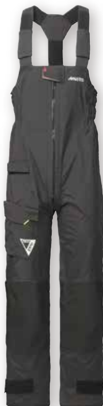
BR1 Channel Trousers