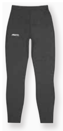
Thermal Base Layer Trousers

比較的に暖かいコンディションでも使用でき、通気性と透湿性、速乾性に優れ、雨天でも晴天でも暖かくドライに保ち Active な動きに抜群。