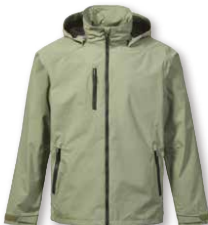
Sardinia Jacket 2.0

Black 991 | True Navy 598 | True Red 169 Platinum 813 | Sea Spray 434 | Racer Blue 536 Aruba Blue/Navy/Antique Sail White 679 36,850 円 (税抜定価: 33,500 円)