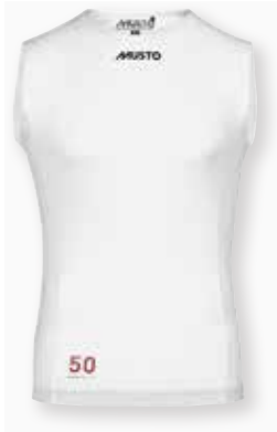
Championship Rash BIB 82092 XS-XXL Black 990 | White 002 7,590 円 (税抜定価 : 6,900 円)