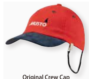
Original Crew Cap