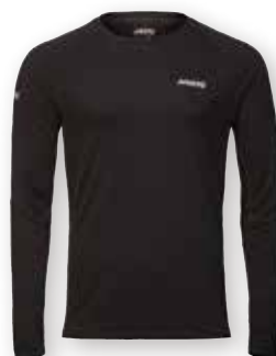
HPX Merino L/S Top