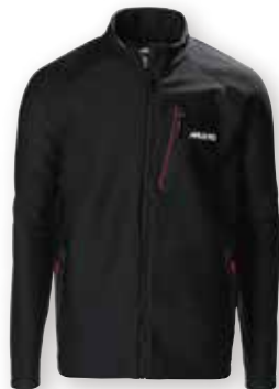
Frome Mid Layer Jacket