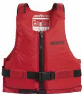
MUSTO Bouyancy Aid