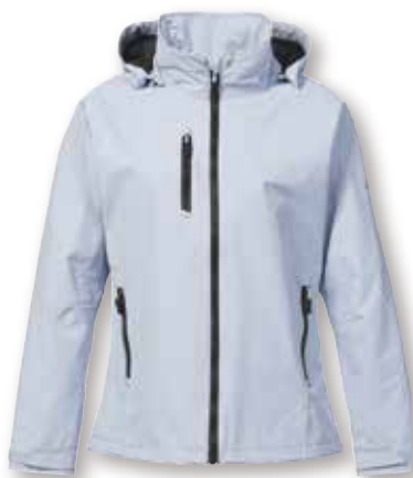
Sardinia Jacket 2.0