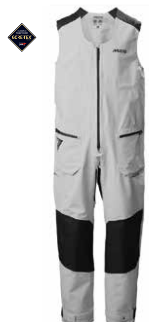
LPX GORE-TEX® Salopette