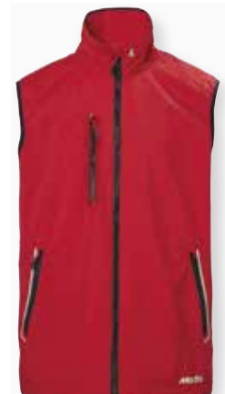
Sardinia Gilet 2.0

Black 991 | True Navy 598 | True Red 169 Platinum 841 | Sea Spray 434 | Racer Blue 536 Aruba Blue/Navy/Antique Sail White 679 36,300 円 (税抜定価: 33,000 円)