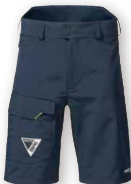
BR1 Solent Shorts 82401 XS - XXL Black 990 | True Navy 598 19,250 円 (税抜定価: 17,500 円)