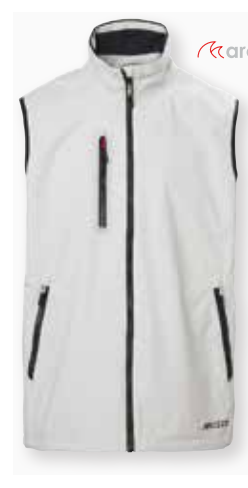
Corsica Gilet 2.0

Black 991 | True Navy 598 | Racer Blue 537 39,600 円 (税抜定価: 36,000 円)