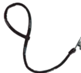
Retainer Clips 86055 Black 991 572 円 (税抜定価 : 520 円)