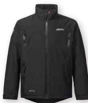
HPX GTX Infinium Mid Layer Jacket