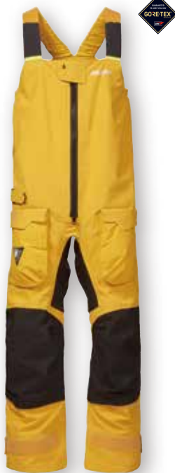
HPX GORE-TEX® Pro Ocean Trouser