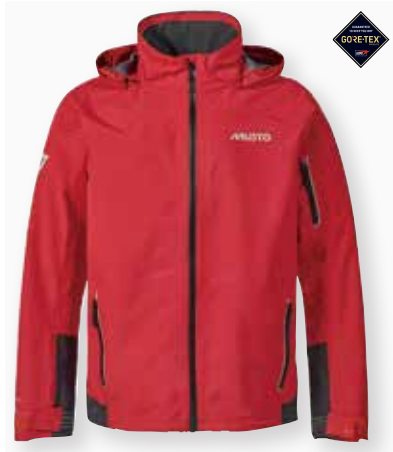
LPX GORE-TEX® Jacket