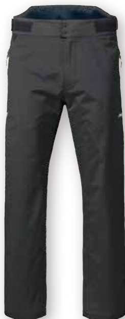
BR1 Solent High Back Trousers 82402 XS - XXL Black 990 27,500 円 (税抜定価: 25,000 円)

インショアレース / インショア / インランド & レジャー / フィッシング / モーターボート