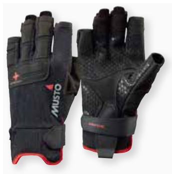
Performance Glove S/F

Black 991 | True Red 169 10,340 円 (税抜定価: 9,400 円)