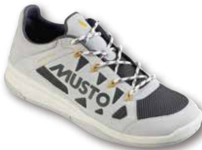
Dynamic Pro II Adapt 82027 7-13 | 7,5-11,5 Platinum 814 | True Navy 598 Vallarta Blue 536 | Aruba Blue 678 24,750 円 (税抜定価: 22,500 円)