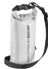
Evolution 1.5L Dry Tube 82279 1.5L / 9cm x 9cm x 34cm weight: 150 g Black 990 | Platinum 813 3,630 円 (税抜定価 : 3,300 円)