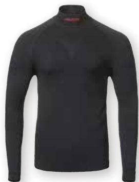
MPX Active Base Layer Top