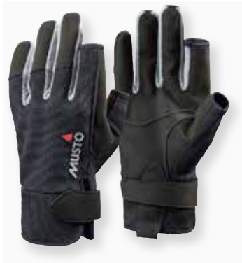
Essential Sailing Glove L/F