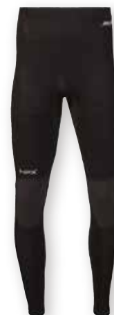
HPX Merino Trousers