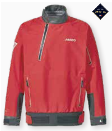
LPX GORE-TEX® Smock