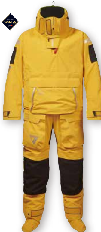
HPX GORE-TEX® Pro Ocean Drysuit

ドライスーツは上半身を脱ぐと作業に合わせて袖を後ろで結んだり、腰に巻いたりしてパンツのようにも使うことができます。また一体化している足のソールには耐性のあるパッチがついています。赤いインフレーションチューブはスーツ内部の空気を抜くことが可能で、緊急時にはこのチューブより空気を吹き込みスーツを膨らませ浮力と断熱性を向上させることができます。まさに救命機能。