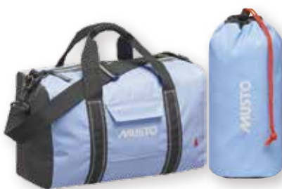
Genoa Small Carryall