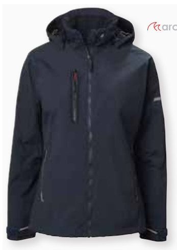
Corsica Jacket 2.0