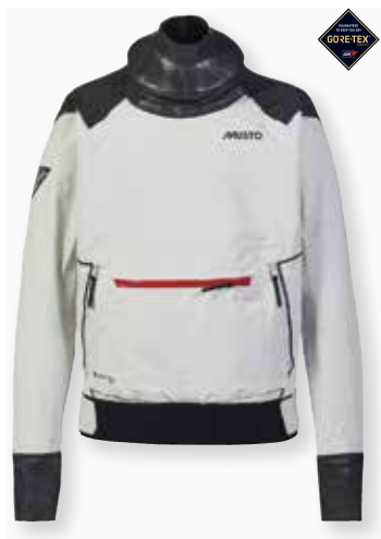
MPX GORE-TEX® Race Dry Smock 2.0