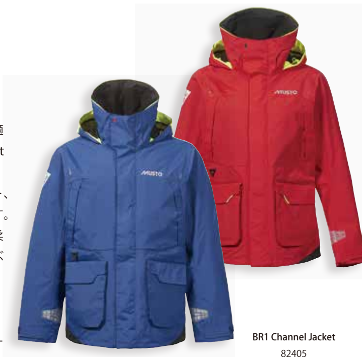
BR1 Channel Jacket 82405

適用分野：インショアレース/インショア/インランド&レジャー/フィッシング/パワーボート