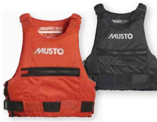
Championship Bouyancy Aid