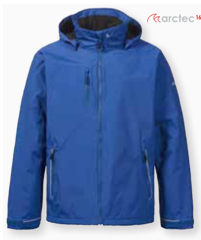
Corsica Jacket 2.0

True Navy 598 | Good Grey 620 | Black 991 36,850 円 (税抜定価: 33,500 円)