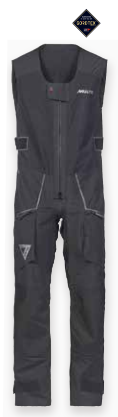
MPX GORE-TEX® Race Salopette 2.0