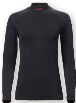
MPX Active Base Layer Top