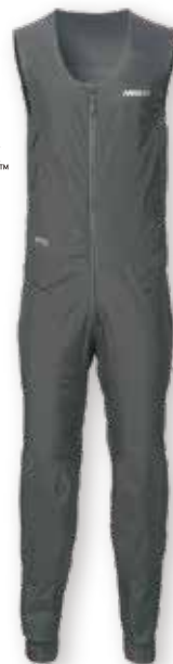
HPX GTX Infinium Mid Layer Salopette