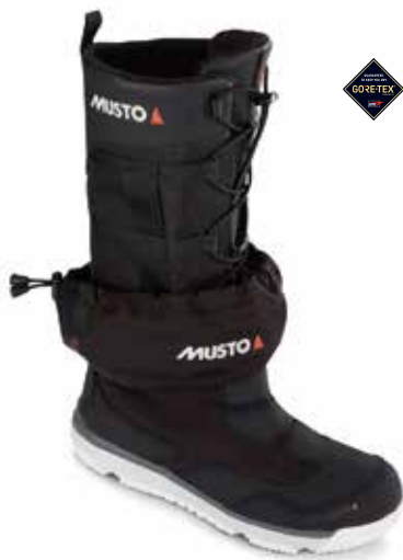
GORE-TEX® Ocean Racer Boots