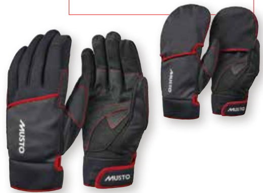
Performance Winter Glove 2.0