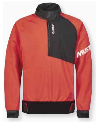
Championship Smock 82093 XS-XXL Black 990 | Sodalite Blue 586 | Oxy Fire 323 | Aruba Blue 678 35,200 円 (税抜定価 : 32,000 円)