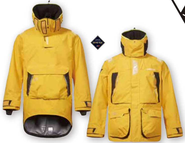
HPX GORE-TEX® Pro Ocean Smock