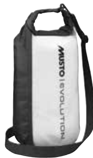
Evolution 10L Dry Tube 82280 10 L / 17cm x 17cm x 50cm weight: 300 g Black 990 | Platinum 813 5,500 円 (税抜定価 : 5,000 円)