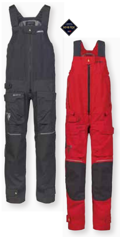
MPX GORE-TEX® Offshore Trousers 2.0 82313 XS – XXL Black 990 | True Red 169 118,800 円 (税抜定価：108,000 円)