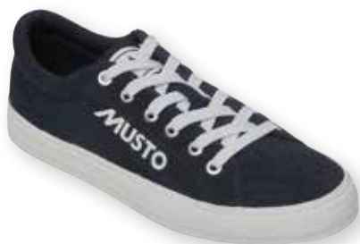
Nautic Zephyr 82029 7-12 True Navy 598 15,950 円 (税抜定価: 14,500 円)

Dynamic Pro II には、ソールに穴があいている特別な排水システム XPL を採用。 靴の中に入った水がすぐに流れ出るので、動きやすく最高の快適さを提供します。 このレガッタ用のシューズにはインソールと裏地が付いていないので水が入ってもすぐに乾きます。 薄いグリップデッキソールは最大のグリップと艇の動きに対するフィーリングを保証します。 ※Dynamic Pro II Adapt はソールに穴はあいてません。