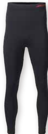
MPX Active Base Layer Trousers