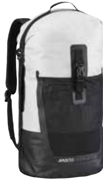
Evolution 40L Dry Backpack 82292 40 L / 45cm x 22cm x 69cm weight: 800 g Platinum 813 | Gold 772 19,800 円 (税抜定価 : 18,000 円)