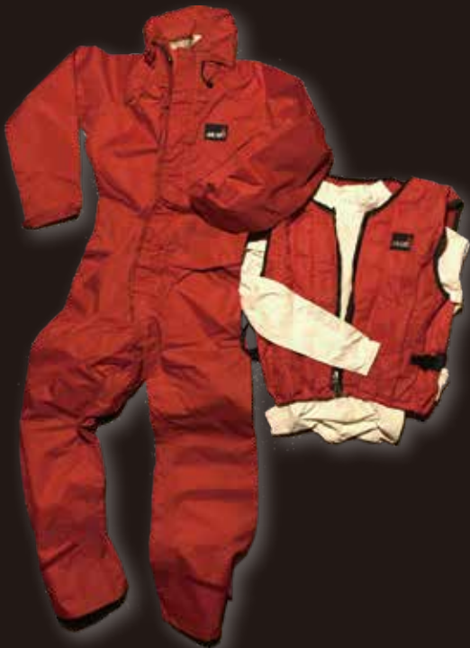
▲写真は、1970年代の製品で超軽量のレガッタベストとワンピースディンギーセーリングスーツ

1973年には日本ヨット協会（現 JSAF）の 470 級コーチとして来日し、日本初の本格的なセーリングコーチの礎を作った。