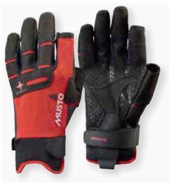
Performance Glove L/F