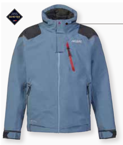
MPX GORE-TEX® Race Jacket 2.0