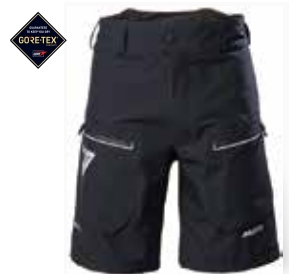
LPX GORE-TEX® Shorts