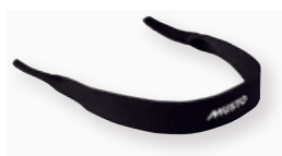
Neoprene Sunnies Retainer 80034 Black 991 572 円 (税抜定価 : 520 円)