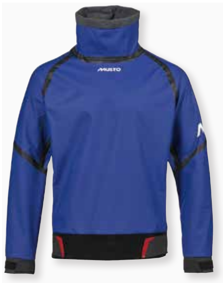
Championship Aqua Top 82089 XS-XXL Black 990 | Oxy Fire 323 | Aruba Blue 678 21,450 円 (税抜定価 : 19,500 円)