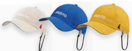
Light Stone 812 | Aruba Blue 678 | Gold 772